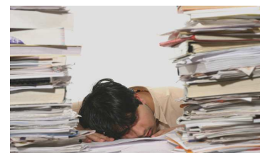
Slip for bunkevis af tasterarbejde ☺

Bevægelserne på kontoen hentes i en fil fra banken, bliver indlæst i din C5 kassekladde med posteringstekster og beløb.